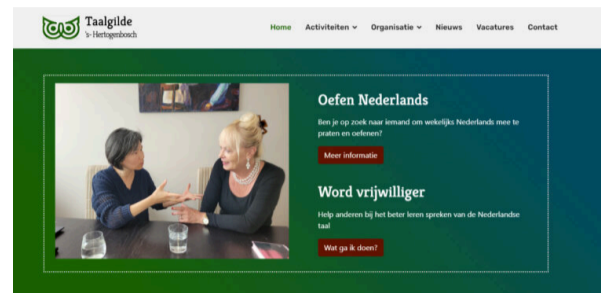
Het Taalgilde Den Bosch brengt taalcoaches en mensen die beter Nederlands willen leren spreken, bij elkaar